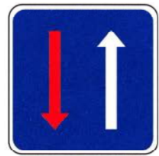
B6 – Prioridade nos estreitamentos da faixa de rodagem