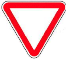
B1 – Cedência de passagem