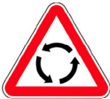
B7 – Aproximação de rotunda