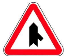
B9d – Entroncamento com via sem prioridade