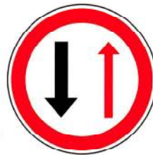
B5 – Cedência de passagem nos estreitamentos da faixa de rodagem