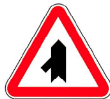
B9c – Entroncamento com via sem prioridade