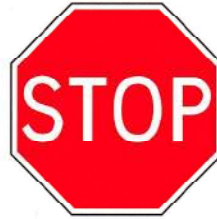
B2 – Paragem obrigatória em cruzamentos ou entroncamentos