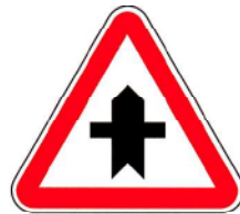
B8 – Cruzamento com via sem prioridade