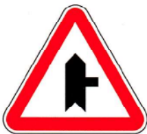
B9b – Entroncamento com via sem prioridade