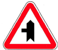
B9a – Entroncamento com via sem prioridade