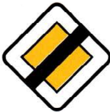
B4 – Fim de via com prioridade